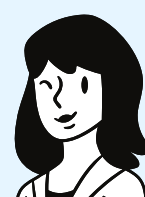
Criado por Marshall B. Rosenberg